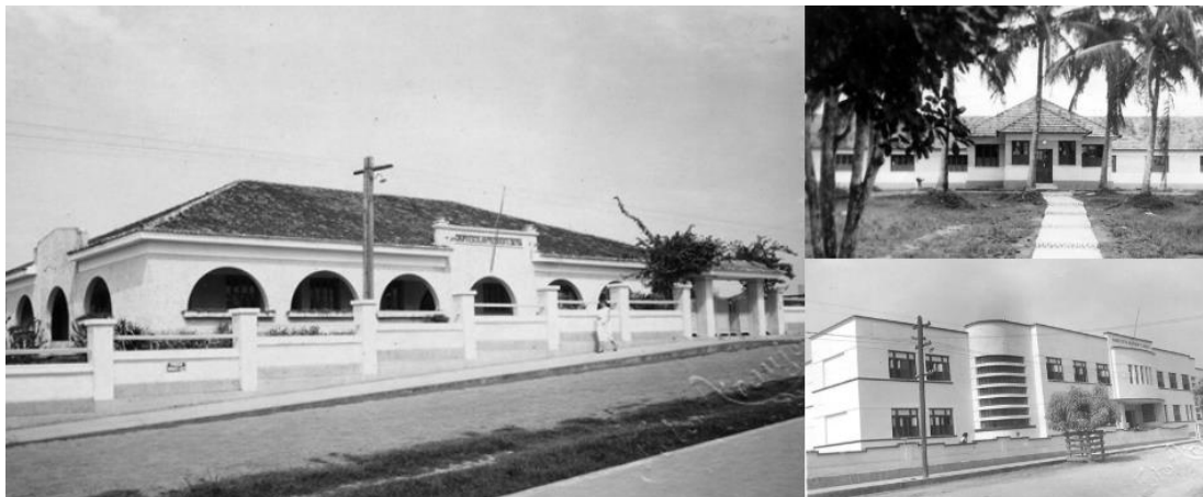
Fotos da capital Rio Branco.

(Adaptado. Fonte: https://cidades.ibge.gov.br/brasil/ac/historico – acesso em 19 de junho de 2019.)